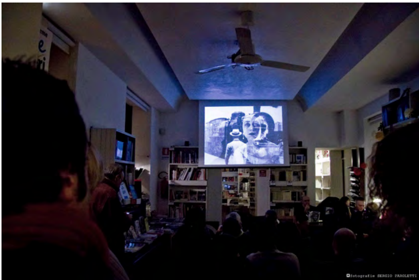
Libreria del cinema. Proiezione film di Paolo Gioli.